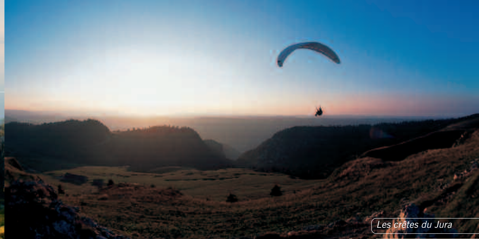
Les crêtes du Jura