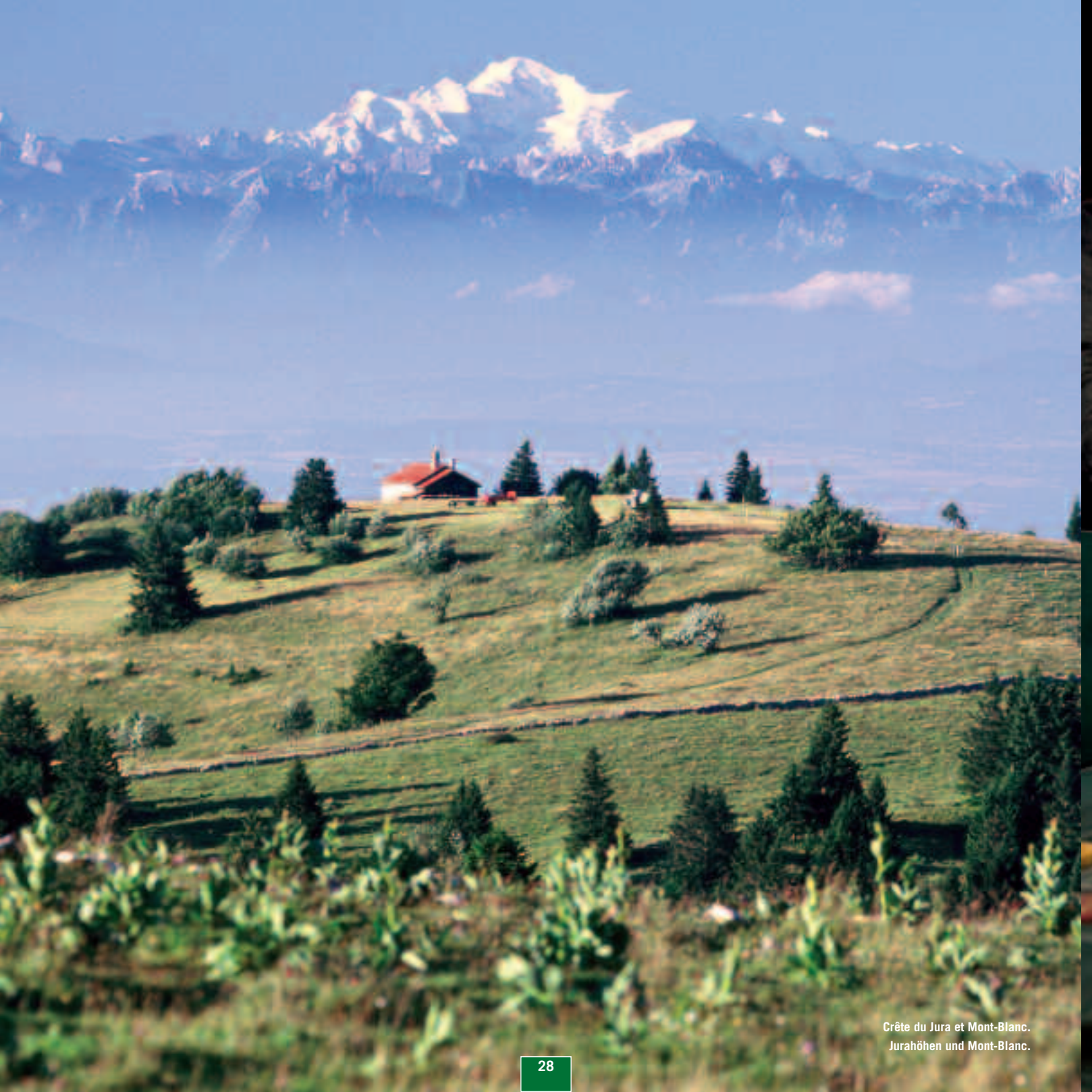
Crête du Jura et Mont-Blanc. Jurahöhen und Mont-Blanc.