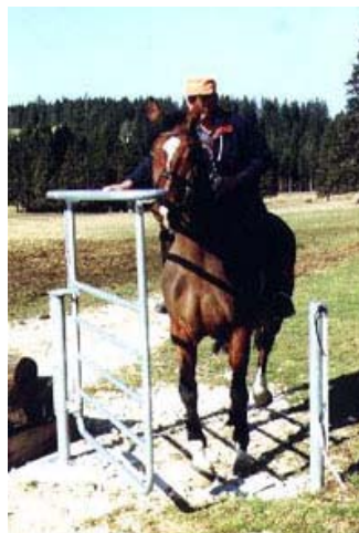
L'ouverture d'un portail

La première étape la plus importante est opérationnelle depuis l'été 2008.