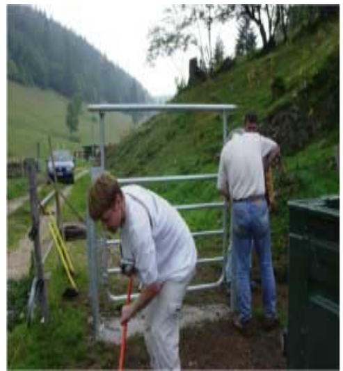
Pose d'un portail par des bénévoles

La pose des portails, environ une quinzaine, est exécutée bénévolement par les membres du comité et de la commission des pistes 1 . Ces portails peuvent s'ouvrir depuis le cheval et la fermeture est automatique. Ils sont notamment utilisés avec succès aux Franches-Montagnes.